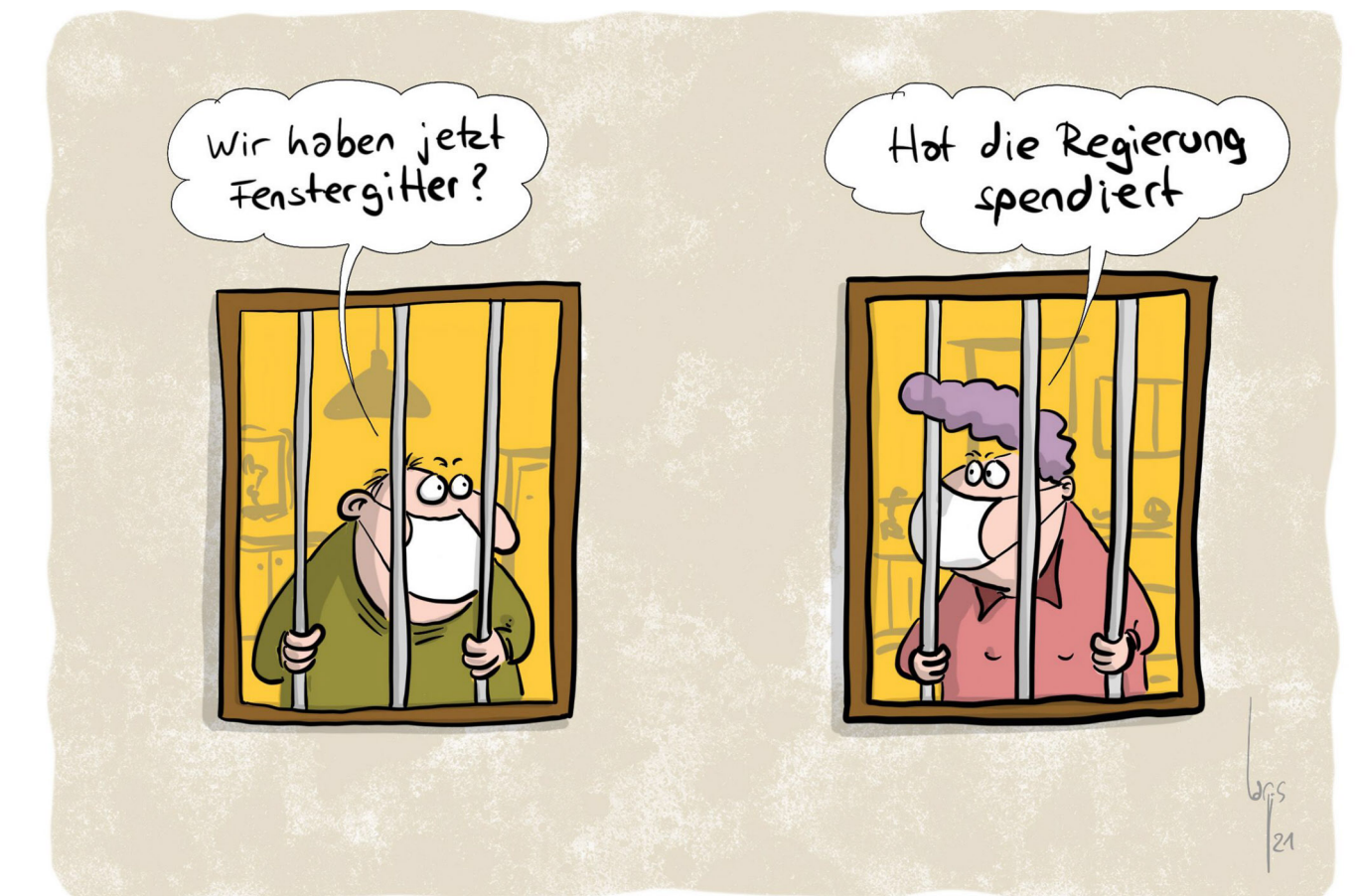
Ganz harter Lockdown...

Mittlerweile zeigen die Pandemie-Zahlen des Dezembers 2020, dass nicht Lockdowns Mittel der Wahl gewesen sind, sondern die Nutzung von Masken und die persönliche Kontaktverhinderung im privaten Bereich. Wenn man unseren Fragebogen im Impfchecker unter http://corona-covid19-hilfe.de/impfchecker/index.php